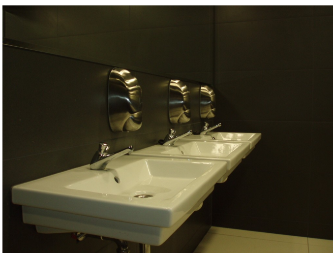
zawór antywandal PRESTO 605