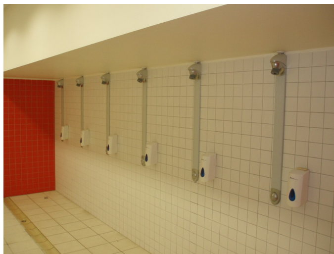
panel antylegionella PRESTO DL 400 SE

armatury na wodę zmieszaną PRESTO : foto stadion EURO 2012 Poznań i Centrum Sportu OAZA Kórnik