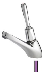
PRESTO SFR III stosowany może być z zaworami na wodę zmieszaną PRESTO 705